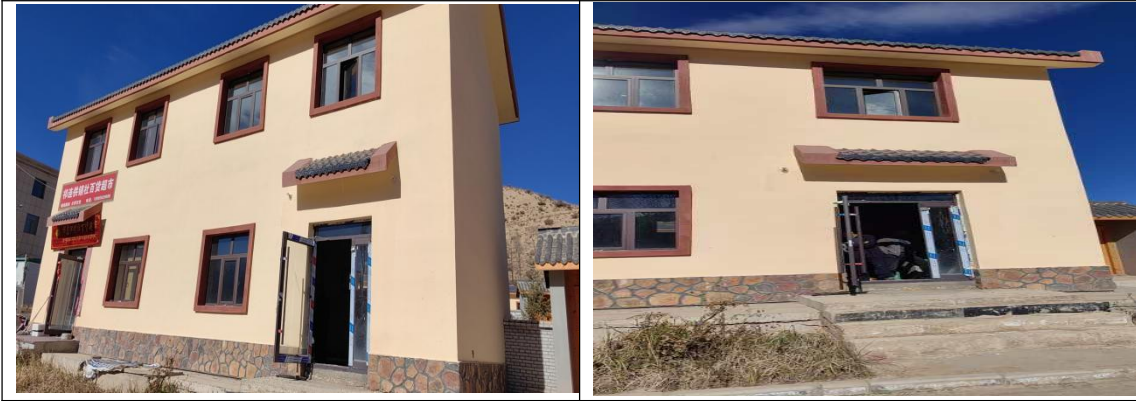
服务站点租用当地民房