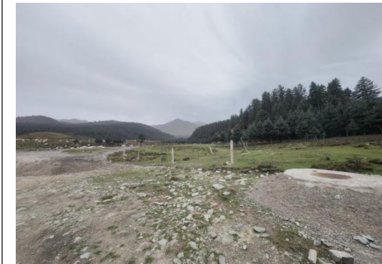
西大滩镇西大滩村截引墙 2