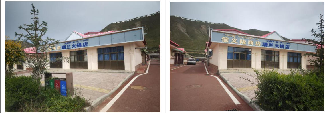
施工营地依托民房（西大滩民房）