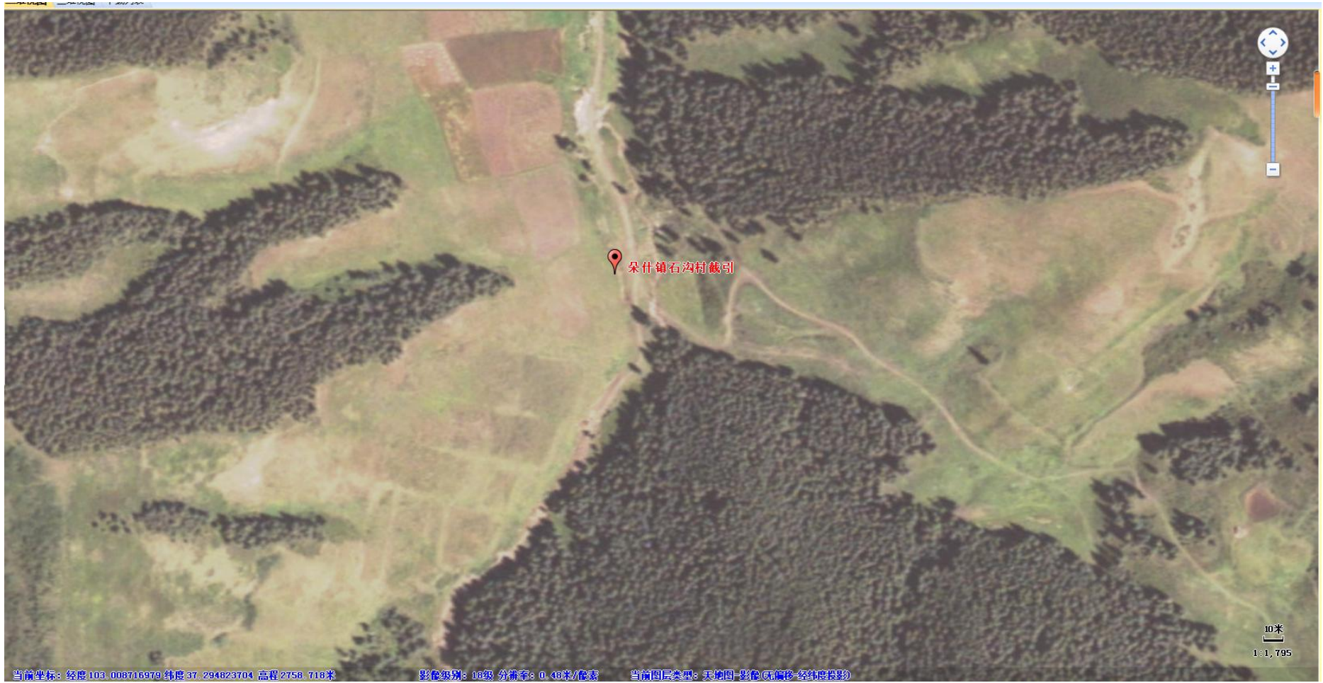
附图3 朵什镇石沟村截引敏感点分布图