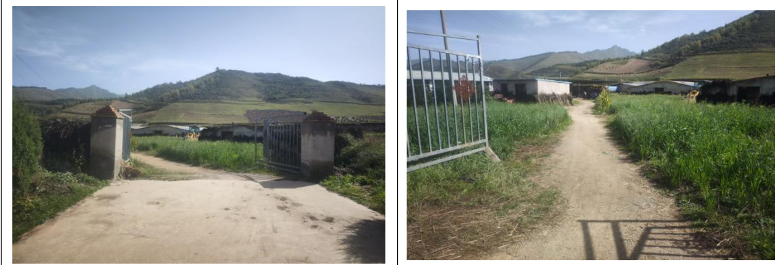
施工营地依托民房（朵什民房）