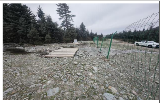
西大滩镇西大滩村截引墙 1