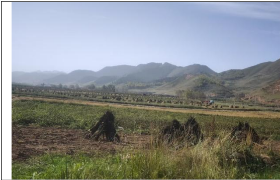
朵什早泉沟村管线生态恢复