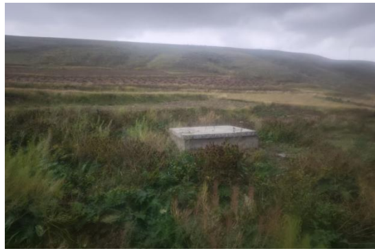
安远直沟 2000 方蓄水池已进行生态恢复