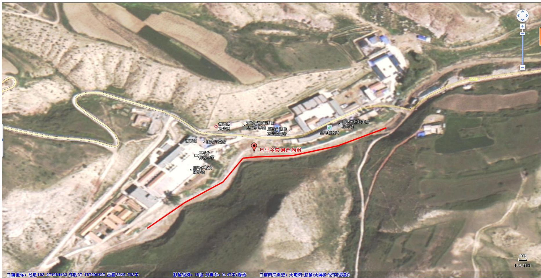
附图 4 旦马乡管网走向环境敏感点图