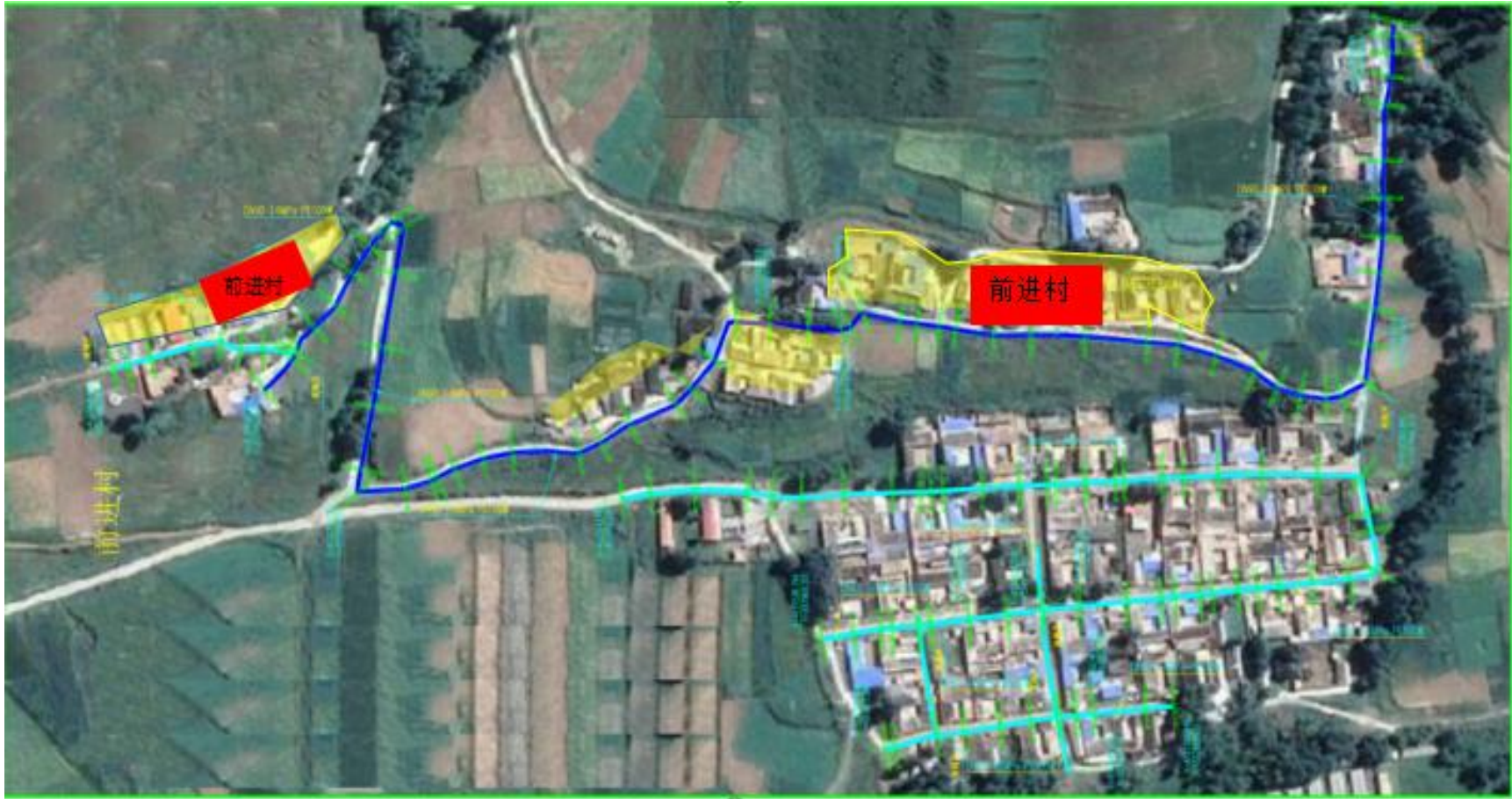
哈溪镇前进村管网敏感点分布图