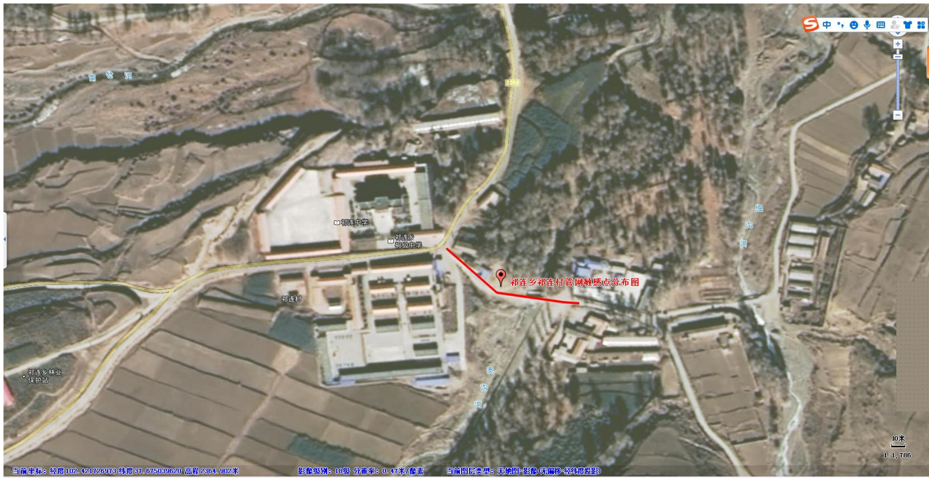
附图5 祁连乡祁连村管网走向敏感点分布图