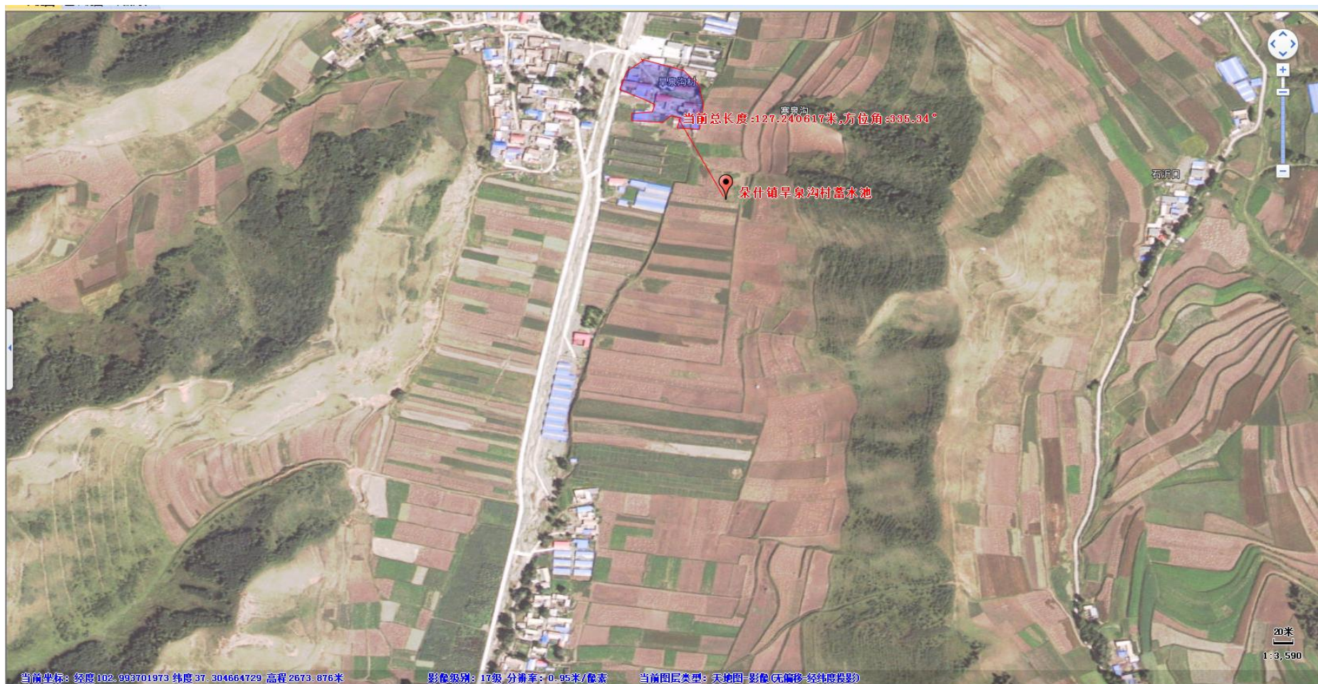
附图2 环评阶段朵什镇早泉沟村蓄水池敏感点分布图