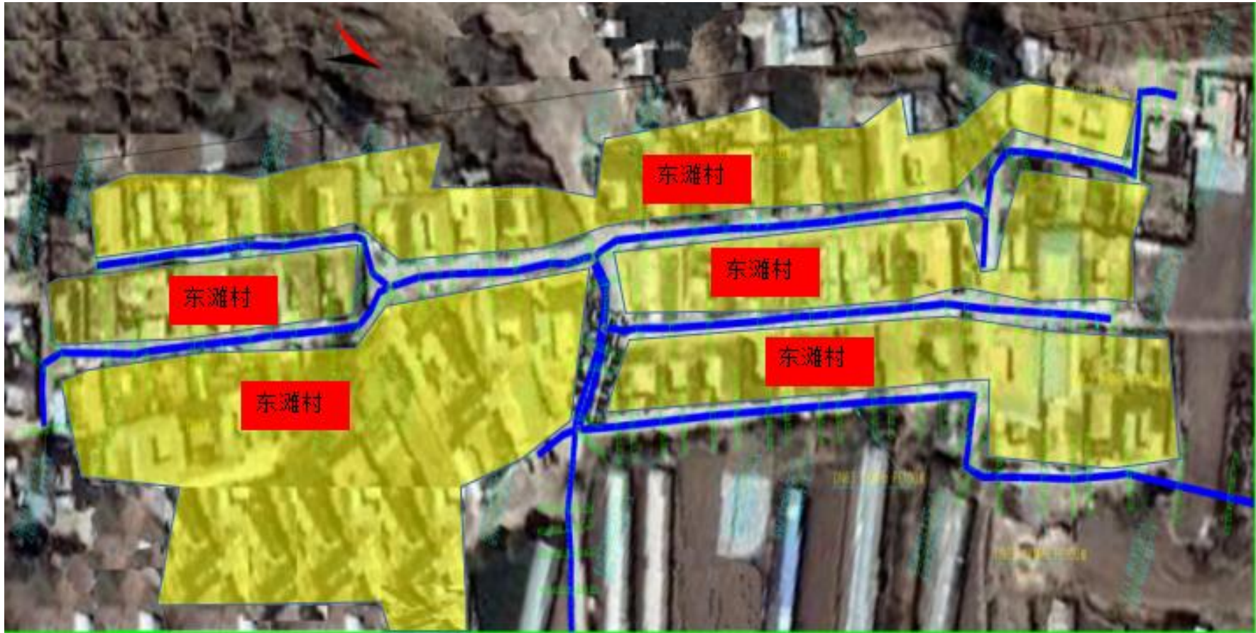
哈溪镇东滩村环境敏感点图