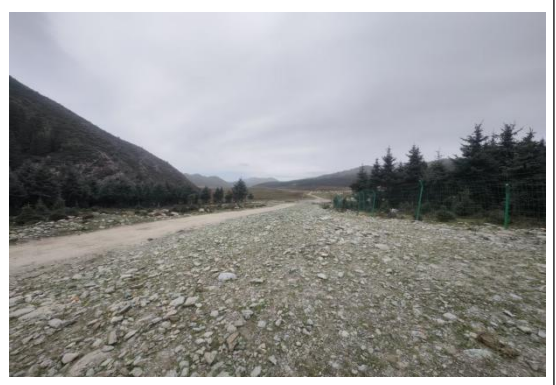
西大滩村管线恢复