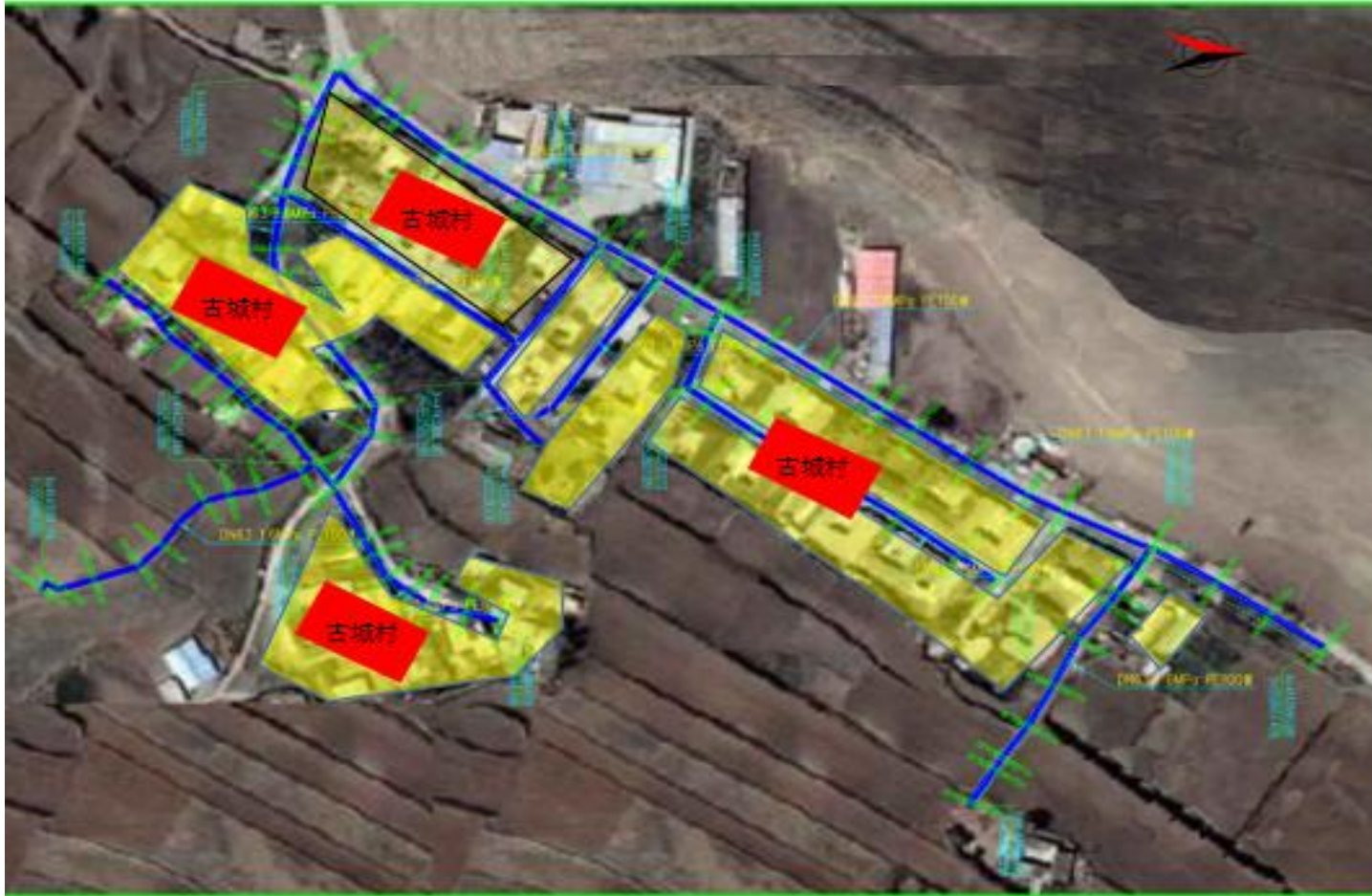
哈溪镇古城村管网敏感点分布图